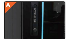
Κλειδαριά ασφαλείας με πόμολο