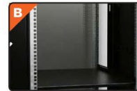
Βάση οδηγού καλωδίων